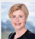
Esther Friedli Ständerätin St. Gallen. Mitglied der ständerätlichen Gesundheitskommission